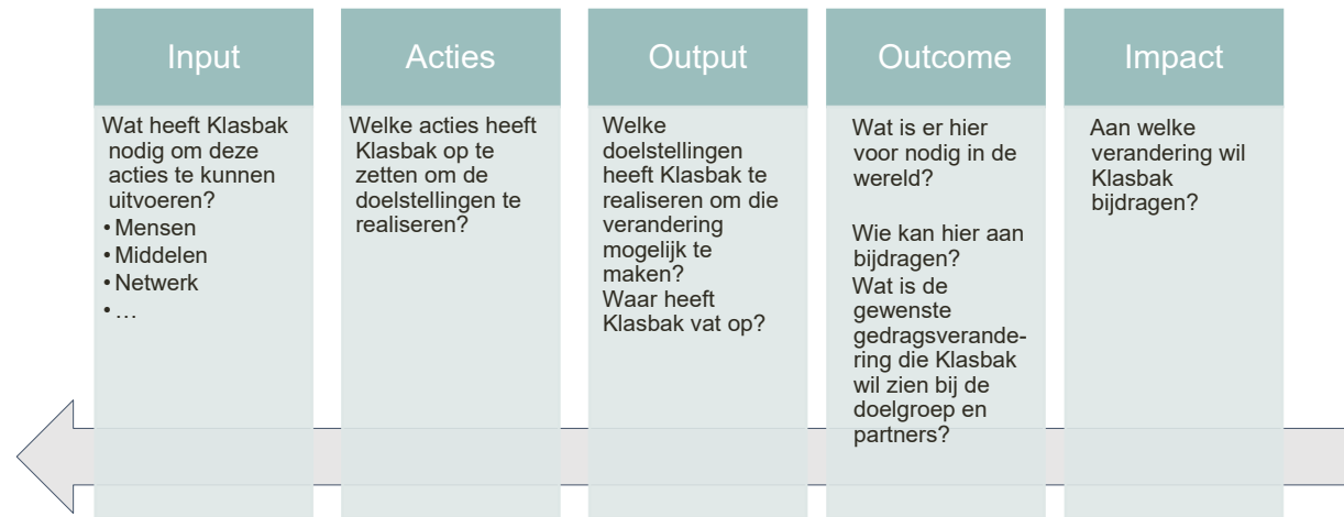
Figuur 2. Impact chain